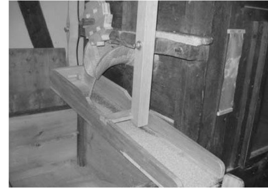
Der Abredder aussen am Mehlkasten, in welchem der Sechskantsichter sitzt

knack, Tanzmännle genannt, setzt über eine Holz Nase den Rüttelschuh unter dem Trichter in Bewegung. Über eine Holzfeder wurde der Rüttelschuh so fest gegen den Dreiknack geführt und damit in Schwingungen versetzt. Dies erzeugt das bekannte Klappern der Mühle. Durch eine Klappe im Trichter rinnt das Korn nun auf den Rüttelschuh und wird durch dessen Bewegungen in die mittige Öffnung der Bütte geschüttelt. Es fällt durch die Öffnung im Läufer-Stein, das Auge, auf den Bodenstein. Fliehkraft und Luftzug saugen das Getreide zwischen die Steine. Die Steine haben Furchen, die sogenannte Schärfe. Diese Furchen wurden von Zeit zu Zeit mit speziellen Werkzeugen nachgeschlagen. Mit einem Spindelkran konnte dazu der Läuferstein herausgehoben werden und auf dem Mahlboden abgelegt werden.