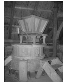
Der Mahlgang der Staubenhofmühle

Vorrichtung zum Vermahlen der Getreidekörner